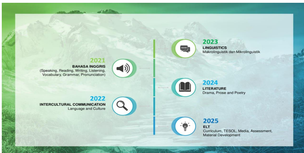
Gambar 2 Roadmap Penelitian Program Studi Tadris Bahasa Inggris

Roadmap riset yang disusun meliputi tahun anggaran, kajian keilmuan, tujuan, metode riset, dan judulriset.